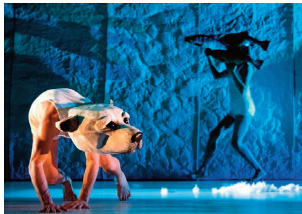
Les danseurs deviennent des êtres mythiques inspirés du nord.